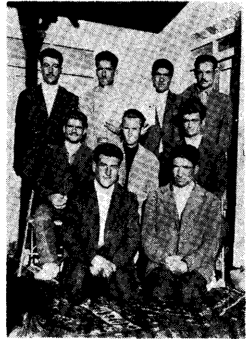
لجنه جوانان بهائی هفتو ( فارس )