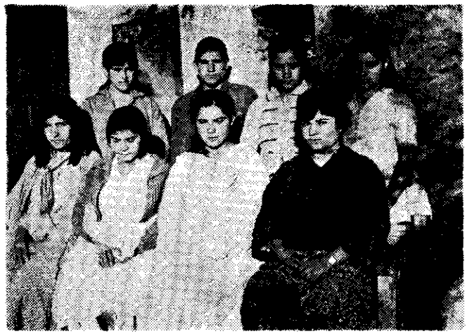
لجنه جوانان بهائی سروستان - فارس