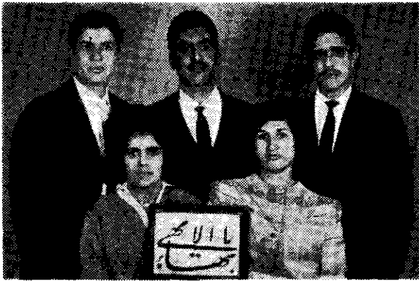
لجنه جوانان بهائی کازرون ( فارس )