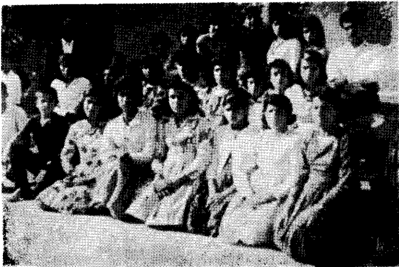
جشن بین المللی جوانان بهائیتی برازجان ( فارس ) ( پنجم فروردین ماه ۱۳۴۳ )