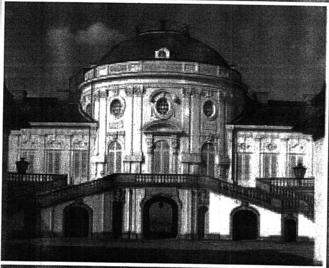
(کاخ تنهانی در اشتهونگار)