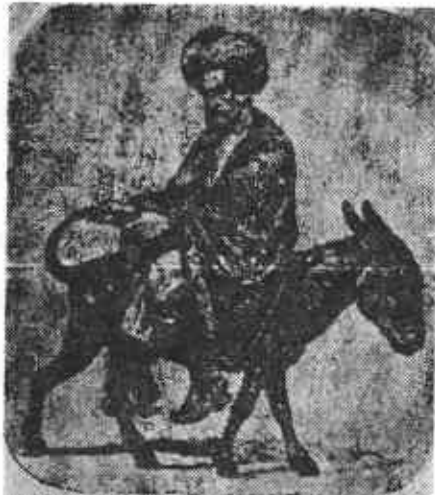
اردستان که نصف ریش او را تراشیده و بارونه سوار خرش کرده و در کوچها گردانند

اسم الله الا صدق ملا محمد صادق مقدس بودند و در شیراز حضرت اصدق امام جماعت بوده اند و در منبر بطلوع و ظهور حضرت اعلی بشارت میدادند جناب مقدس و ایشان را حاکم شیراز حسینخان میگیرد و چوب میزند و مهار میکنند (۱) و در بازار و محله های شیراز در معیت حضرت قدوس میگردانند و آخراً میکنند و پیاده بدون زاد و راهل بکرمان میروند و از کرمان بعد از خدمات و اذیات لانهایه به یزد میروند و از یزد کذک بعد از خدمات و مشقات بدایس و تون و بشرویه و بلد خراسان و دمه جا زیر شمشیر و زنجیر و اسیری بودند و بشارت ظهور را علانیه باینه و برهان میداده اند تا در مشهد مقدس در ظل رایت مرتفعه حضرت باب الباب که در احادیث و اخبار بسیار است رایت اسود که از خراسان و مشرق بلند میشود رایت قائم است بشتابید بسویش و لو بسینه روی برف باشد و در غسل آن علم مبین بیدشت میروند (۲) و از بدشت بمازندران و بعد از شهادت ۳۱۳ نفر در تبرستان چنانچه در حدیث مذکور است جناب مقدس را میفروشند و جناب ملاعلی اکبر و جناب آقا میرزا حیدرعلی در قربانگاه باشد امید میشوند و لوسی بخواست خدا رعتی داشته اند و شب از قربانگاه خود را بیرون انداخته و بزحمات زیاد بعد از دوسه ماه باردستان میسرانند (۳) (۱) حاج میرزا اجانی (۲) علمهان سیاه بیدشت نرفته اند (مؤلف) (۳) بهجت الصدور