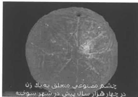
چشم مصنوعی متعلق به یک زن در چهار هزار سال پیش در شهر سوخته