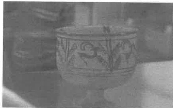
(۲) ظرف سنگی از جیرفت