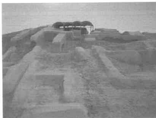
(۴) زیگورات در جیرفت