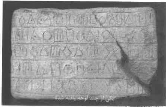
(۱) قدیمی ترین خط جهان - یکی از چند لوحه یافته شده