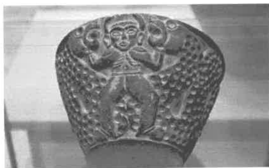
(۶) ظرف سنگی استوره گلیگمش