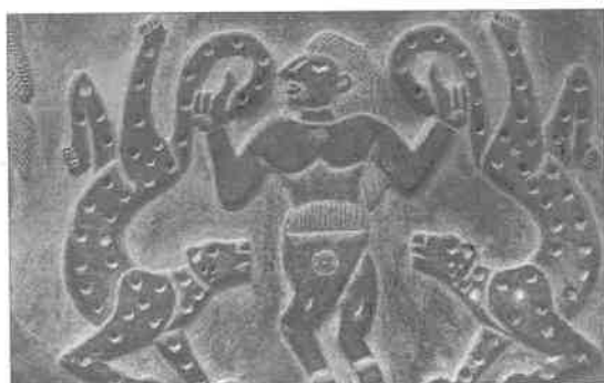
(۵) ظرف سنگی استوره گلیگمش