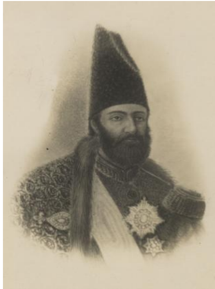
میرزا تقی خان امیرنظام، امیر کبیر

از مقام استغناى خود بیانی فرمودند و سفر به عراق را قبول نمودند و به فاصلهٔ چند یوم که تنظیم امور و تهیة سفر کردند با میرزا شکرالله که از منتسبین بود و با مستخدم خود میرزا محمد مازندرانی سوار بر اسب به طریق کرمانشاه راندند. ۱ و حرکت از طهران در اوائل شهر شعبان ۱۲۶۷ هـ ق [ژوئن ۱۸۵۱] واقع شد و شهر