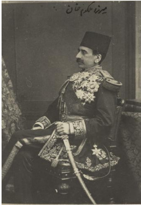
میرزا ملکم خان

معتقد و مطمئن به بیانات مبارک نشد و به خیالاتشان اشتغال داشت که ناگاه ملکم خان از طهران فرار نموده خود را به بغداد رسانید و به محضر جمال ابهی وارد شد ولی صلاح