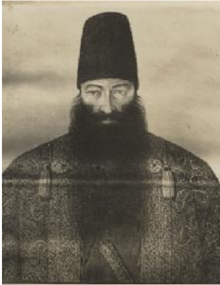
طهماسب میرزا مؤیدالدوله

امور نیریز می کرد ابدأً تعرّض به بایّه نمود تا آنکه میرزا نعیم با دو فوج سرباز و استعداد مقاتلت ورود به نیریز نمود و علی سردار شهیر مذکور و بایان از او مراسم استقبال و اجلال به جای آوردند. و در چند روز اوّل تعرّضی نکرده حیل و تدبیری اندیشید که بدون احتیاج به اعمال اسلحه ایشان را دستگیر سازد. لذا مأمور مخصوص چاپلوسی به محلّه بایّه فرستاد عنوان دادگستری و احقاق حقوق مظلومان از ورثه میرزا زین العابدین خان به میان آورده ایشان را امیدوار ساخت. آورده اند که زوجه میرزا زین العابدین با میرزا نعیم در خلوت ملاقات کرده وعده و نوید داده از او خواست انتقام شوهر را از بایّه گیرد. و چنین تدبیر نمود که به نوع مذکور آنان را در دار الحکومه مجتمع ساخته دستگیر کنند.