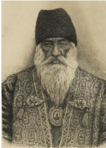
میرزا یوسف خان مستوفی الممالک آشتیانی

ماند. آن گاه لباس درویشی در بر کرده تاج و آگال ۱ بر سر و رشمه ۲ بر کمر و پوست تخت ۳ بر پشت و کشکول و تبرزین به دست از طریق بیراهه جنگل مازندران ترسان و لرزان به اتفاق عمّش ملاّ زین العابدین و با ملاّ رمضان بگریخت. و خود را پیاده به بندر مشهدسر بارفروش مازندران رساند و با ملاّ زین العابدین به کشتی در آمده به بندر انزلی رشت وارد شدند و مخفتی و متواری گشت. و با اینکه عمّال دولت به شدّت در تجسس او بودند جان از ورطه هلاکت به در برد.