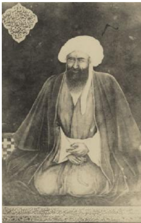
حاج شیخ مرتضی الانصاری

و مجملی از کیفیت واقعه چنین است که آقا سید محمد مذکور نوبتی به عزم زیارت کاظمین رفته در بغداد به خانه حاجی جعفر دولت آبادی وارد شد و حاجی