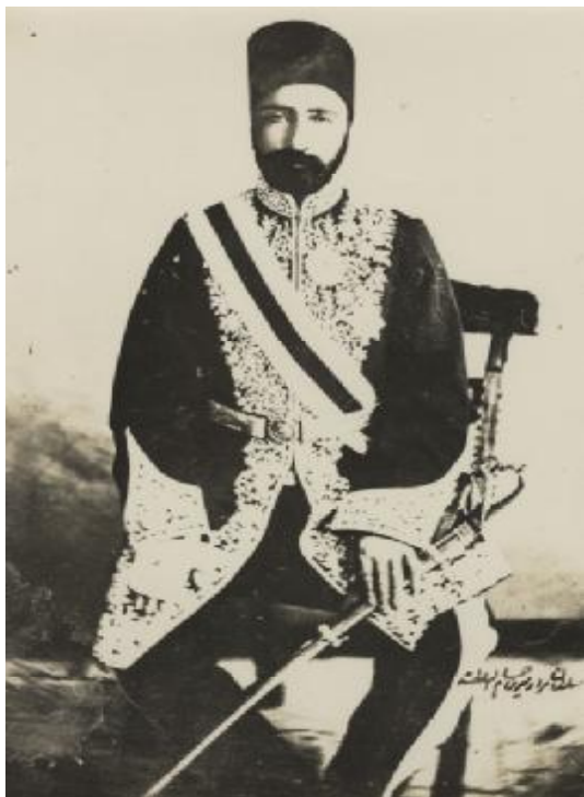
سلطان مراد میرزا حسام السّلطنه

که در بخش سابق آوردیم مستخلص کردند. ۱ و در قائین سید ابو طالب مجتهد برای حسادت و رقابت با آقا محمد فاضل و برای تعصّب و ضدیت با این امر به مقاومت با فاضل و جمعی از احبّاء که به واسطه او گرد