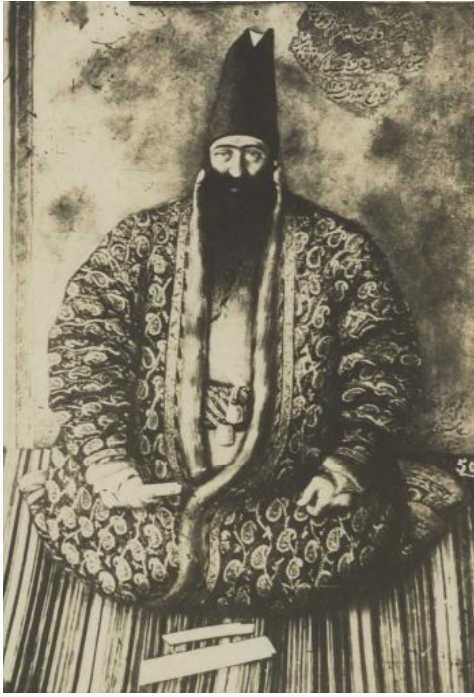
میرزا آقا خان اعتماد الدوله (صدر اعظم نوری)

اسرا در بین طریق از سواران و مردم هر محلّ جور و جفای بسیار وارد آمد. و در یالوشی همگی را در خرابه مسکن دادند و اهالی آنان را سنگسار کردند. و چون به طهران رسیدند نسوان را در خانه محمود خان کلانتر و رجال را در انبار حبس نمودند.