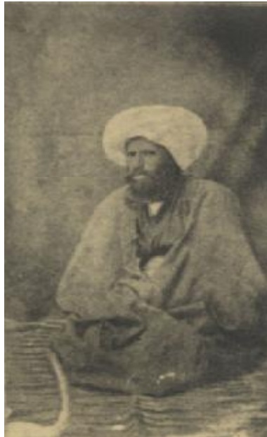
ملا جعفر نراقی

و بالجمله امور مذکوره سبب مزید حسد میرزا یحیی گردید و شروع نمود از نوشتجاتش به دوستان خود به نوع اشاره ذکر استقلال و قاهریت جمال مبارک و مقهوریت خویش نمود و همدستانش بیش از پیش به نشر مفتریات و ابراز بغض و عناد پرداختند، چنانکه مشروعاً معترضانه از ملا جعفر نراقی به محضر مبارک رسید. و در عین حال الواح و آثار ابهی علما و مبلغین و مؤمنین را در بلاد ایران روح جاوید بخشیده به نشر امر بدیع برانگیخت. و لاجرم مبغضین و اعداء به تهیج ۱ فتنه و فساد برخاستند.